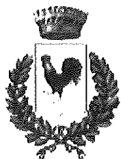
Comune di Galluccio