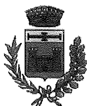
Comune di Marzano Appio